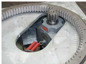
Transport- und Drehgestelle- / Lagertechnik