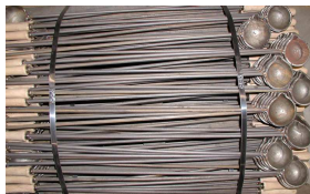
Verschleißteile für die Stahl- und Aluminiumerzeugung