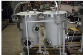
Konstruktionen und Bauteile für die Chemische Industrie