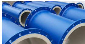
Behälter u. Anlagen / Rohrformteile für die Wasser- und Umwelttechnik